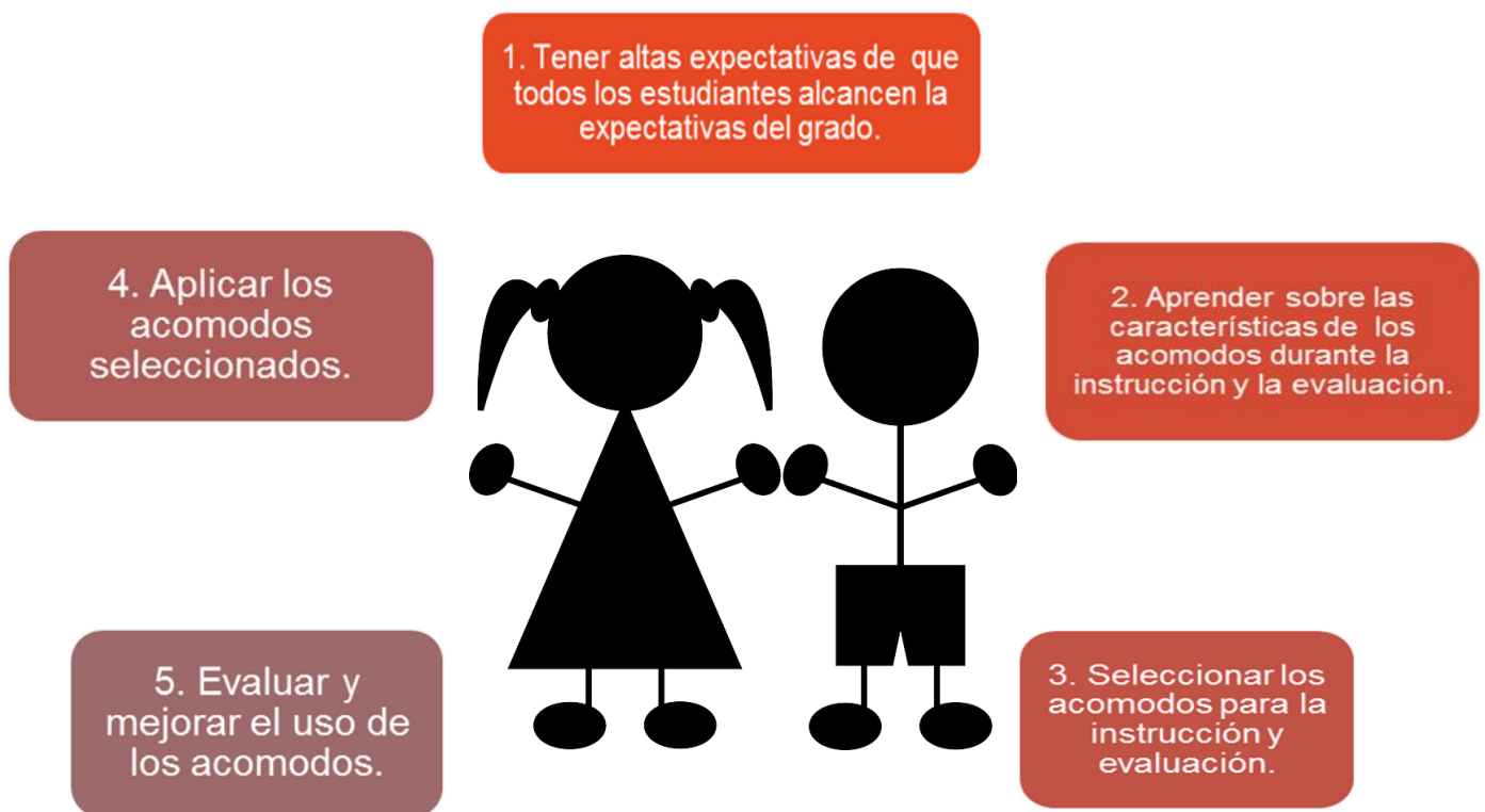
Diagrama 2: Toma de decisiones

Los maestros utilizarán esta información para ayudar a formular metas y puntos de referencia para el logro estudiantil tanto en el rendimiento académico como en el dominio del idioma español. El éxito de los aprendices del español y de los inmigrantes dependerá en gran manera, del proceso de la toma de decisiones para determinar los acomodos necesarios de estos estudiantes (ver Diagrama 2).